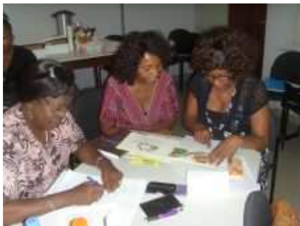
Oefenen met Begeleid Hardop Lezen