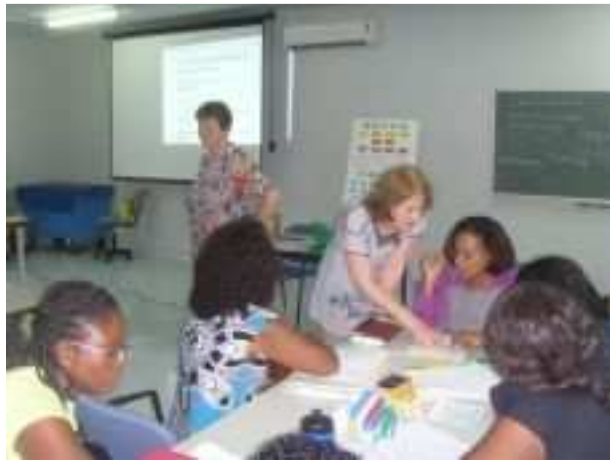
Oefenen met Taal in Blokjes

In de trainingen voor professionals uit het veld is veel informatie gegeven over leesproblemen en dyslexie. Ook is er geoefend met de genoemde methodieken.