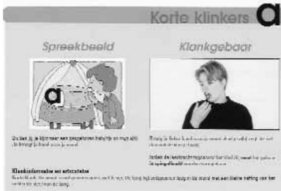
Een bladzijde uit het werkboek van Spreekbeeld.